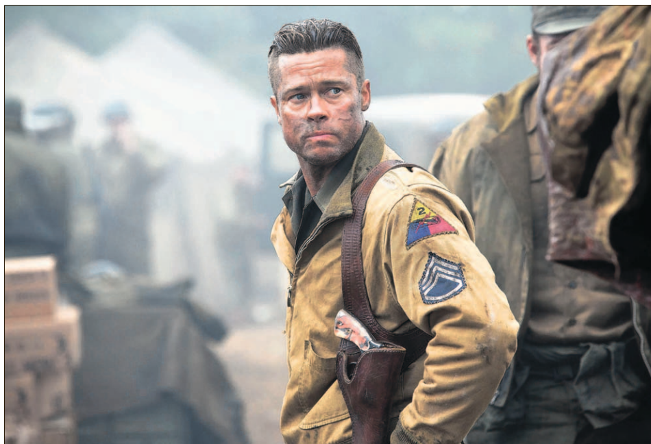
■ Brad Pitt op de foto in zijn rol als tankcommandant: ‘Als iemand Angelina of onze kinderen zou bedreigen? Ik zou hem doden zonder met mijn ogen te knippen. Ik weet nu dat ik daartoe in staat ben.’